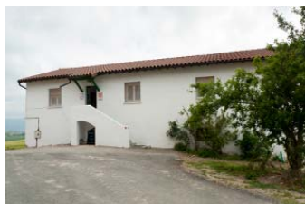
Albergue de peregrinos de la Orden de Malta Cizur Menor (Navarra) Tfno: 616 65 13 30