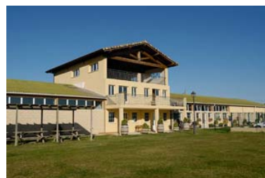
Albergue Santiago Apostol Puente La Reina (Navarra) Tfno: 948 34 02 20, 660 70 12 46