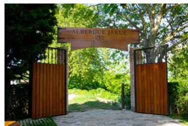
Albergue Jakue Puente La Reina (Navarra) Tfno: 948 341017