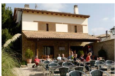
Albergue Camino del Perdón Uterga (Navarra) Tfno: 948 344 598, 948 344 661, 690 841 980