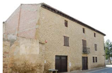
Albergue Usda Obanos (Navarra) Tfno: 676 56 09 27