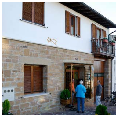
El albergue de Zariquiegui Zariquiegui Tfno: 948 35 33 53, 679 23 06 14