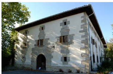
Albergue Familia Roncal Cizur Menor (Navarra) Tfno: 670 323 271