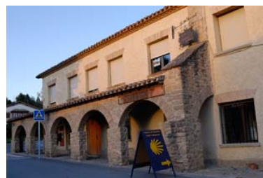
Albergue de los Padres Reparadores Puente La Reina Tfno: 948 34 00 50, 689 447 222 (En este móvil desde Semana Santa a noviembre)