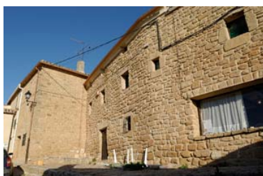
Albergue Hogar Monjardín