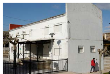
Albergue Isaac Santiago