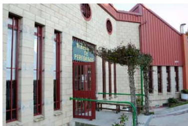
Albergue San Cipriano de Ayegui